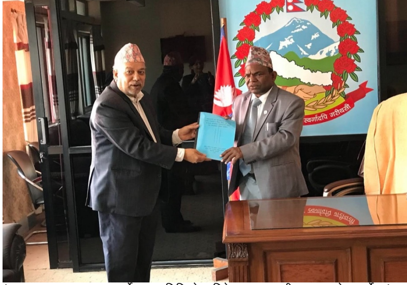
संगठन तथा व्यवस्थापन सर्वेक्षण समितिको प्रतिवेदन मा. मन्त्रीज्यूसमक्ष पेश गर्दै संगठन तथा व्यवस्थापन समितिका संयोजक तथा संघीय मामिला तथा सामान्य प्रशासन सचिवज्यू ।