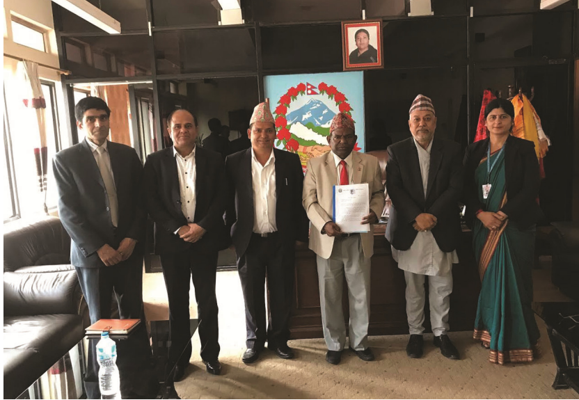
संगठन तथा व्यवस्थापन समितिका पदाधिकारीहरू ।