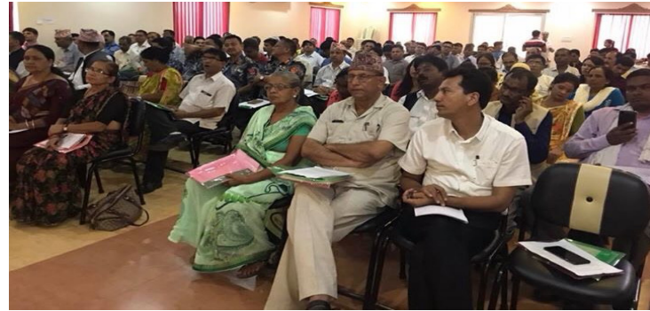
बुटवलमा सम्पन्न प्रदेशस्तरीय अन्तरक्रिया कार्यक्रम