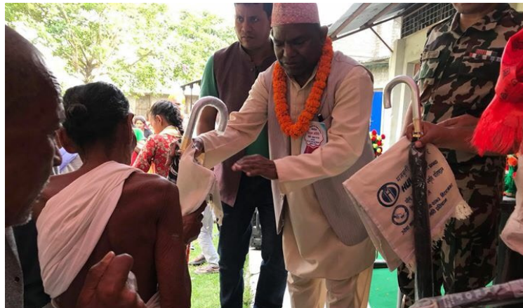
मा. मन्त्रीज्यूवाट मोरङको बुढीगंगामा असहाय बालबालिकालाई सामग्री वितरण गरिदै