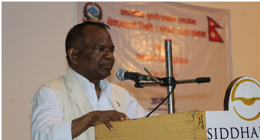
नेपालगञ्जमा आयोजित अन्तरक्रिया कार्यक्रमका तस्वीरहरू ।